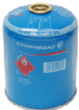
PROPANE/BUTANE Camping GAZ® CV-470 / CV-270