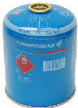
PROPANE/BUTANE Camping GAZ® CV-270 / CV-270 Plus CV-470 / CV-470 Plus