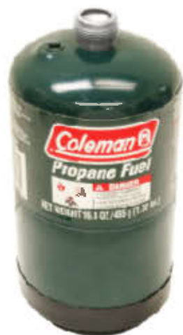
PROPANE DOT-39 NRC